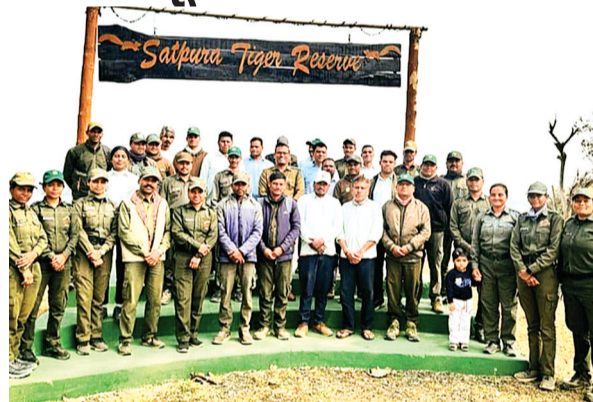
हरिभूमि न्यूज | सोहागपुर

विश्व आर्द्रभूमि दिवस पर सतपुड़ा टाइगर रिजर्व कामती परिक्षेत्र में सोमवार को जागरूकता कार्यक्रम किया गया। आयोजन में परिक्षेत्र अंतर्गत कार्यरत गाइड्स, वाहन चालक एवं स्टाफ को पावर पॉइंट के माध्यम से आर्द्र भूमि के महत्व के संबंध में जागरूक किया गया। इसके अलावा सभी उपस्थितजनों को सतपुड़ा टाइगर रिजर्व के अंतर्गत रामसर साइट तवा जलाशय में पाए जाने वाले जलीय जीव जंतु एवं पौधों की जैव विविधता के संबंध में जानकारी दी गई। मद्द्ई गेट के आसपास साफ सफाई का आयोजन भी किया गया जिसमें गाइड्सस वाहन चालक एवं स्टाफ सहित पर्यटक भी सम्मिलित हुए। पर्यटकों को इस दौरान समझाया गया कि संबंधित क्षेत्र में प्लास्टिक, पॉलिथीन एवं अन्य कचरा ना फेंका जाए।