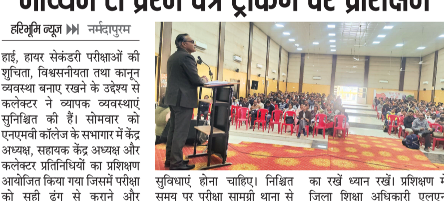
हरिभूमि न्यूज | नर्मदापुरम