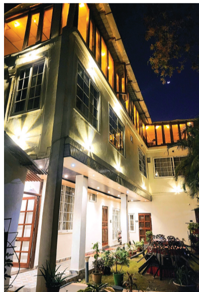
सुबह 8:30 बजे हुआ धमाका

मध्य प्रदेश के एकमात्र हिल स्टेशन पचमढी में सोमवार सुबह एक बड़ा हादसा हो गया। यहाँ के प्रसिद्ध होटल सेरेंजिटी के किचन में सुबह नाशता बनाते समय अचानक गैस सिलेंडर फट गया। इस धमाके की चपेट में आने से होटल के कुक और महाराष्ट्र से आए एक ही परिवार के चार सदस्यों सहित कुल 5 लोग घायल हो गए हैं।